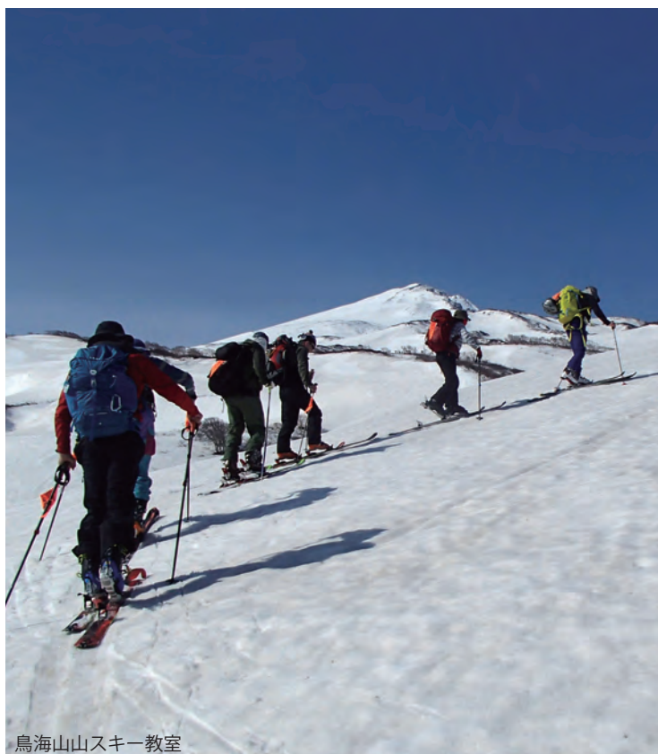
鳥海山山スキー教室