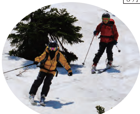
八甲田山山スキー教室