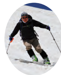
八甲田山山スキー教室