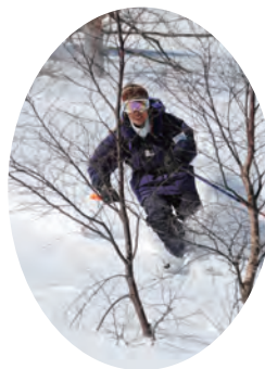
湯ノ丸高原山スキー教室