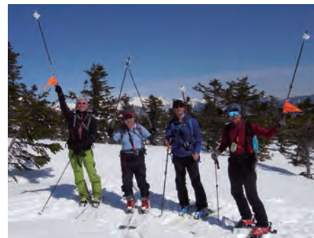
乗鞍高原山スキー教室

東京都勤労者スキー協議会 山スキー委員会 東京都豊島区東池袋2-39-2 大住ビル 402 Tel 03-3971-4144