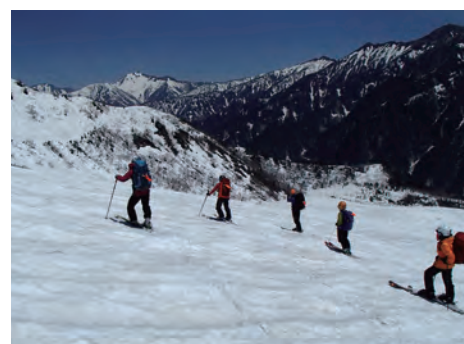
立山・剣沢山スキー教室