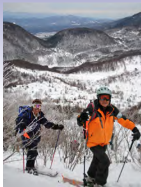
湯の丸高原山スキー教室