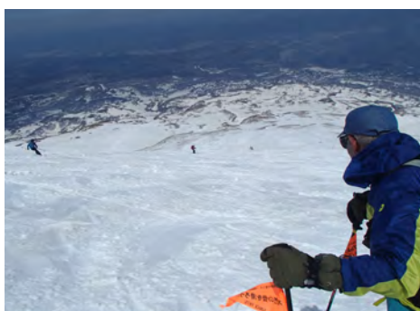
鳥海山山スキー教室