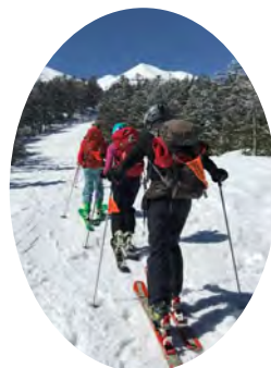
乗鞍高原山スキー教室