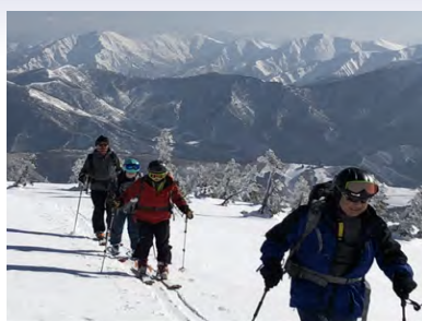
かぐら峰山スキー教室