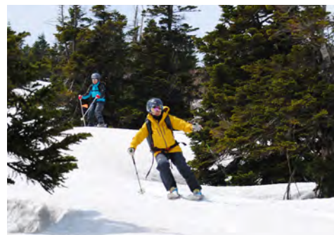
八甲田山山スキー教室