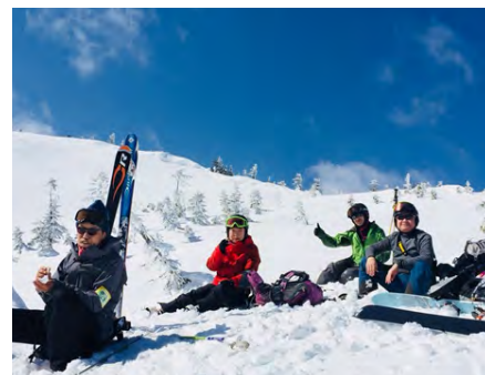
かぐら峰山スキー教室

東京都勤労者スキー協議会 山スキー委員会 東京都豊島区東池袋2-39-2 大住ビル402 Tel 03-3971-4144