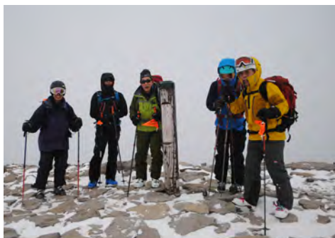
湯の丸高原山スキー教室