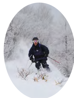
湯ノ丸高原山スキー教室