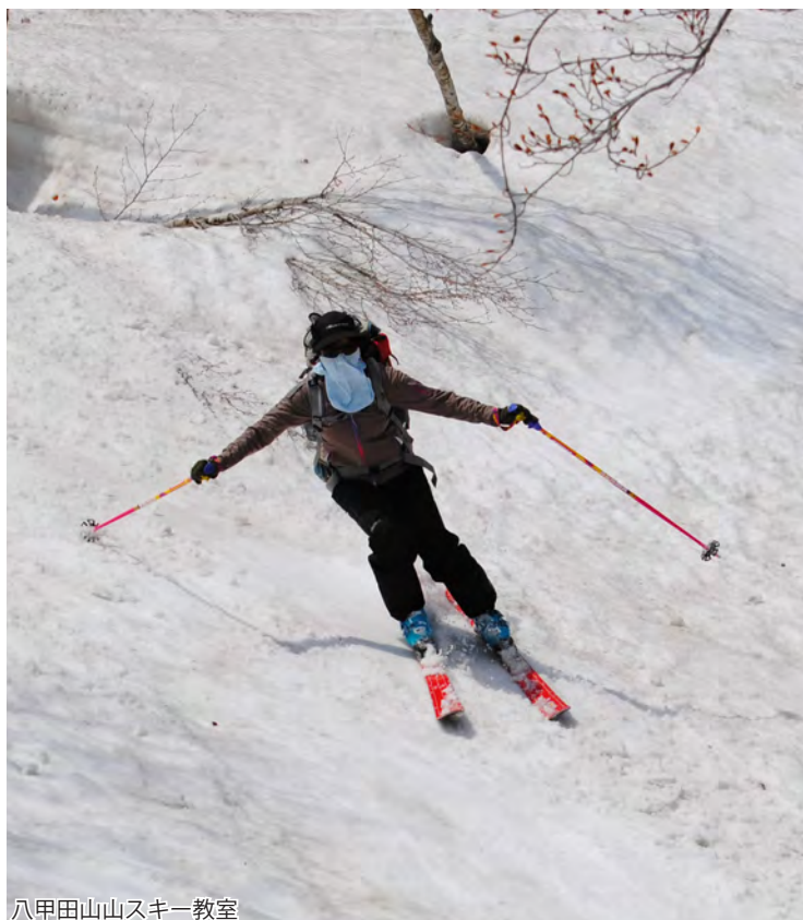
八甲田山山スキー教室