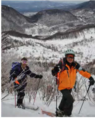
2017 山スキー教室から

湯の丸山 (2,101m) の南東にひろがる灌木と草原の広い斜面は、山スキーの適地として知られています。スキー場のリフトを活用して、湯の丸山の樹林の中・広大な斜面の自然の雪を楽しみ、山頂からは近くに浅間山・四阿山、遠くに富士山・北アルプスの山々が 360 度の展望が開けています。