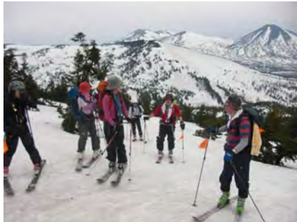
アオモリトドマツの間を山頂目指し

大岳を主峰として田茂菴岳、高田大岳の北八甲田、楯ヶ峰を主峰として猿倉岳、乗鞍岳の南八甲田からなる八甲田山は、山スキーに最適な斜面が数多くあり、多くの山スキーヤーに愛されています。