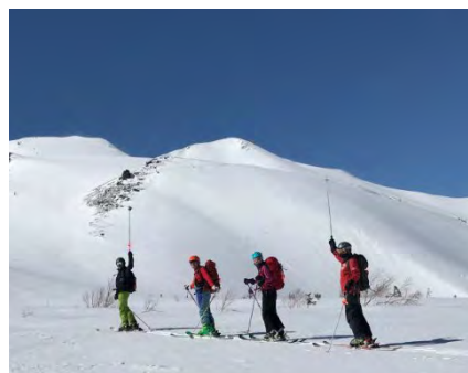
乗鞍高原山スキー教室