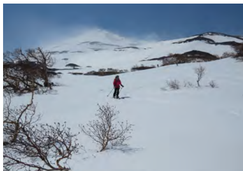
鳥海山山スキー教室