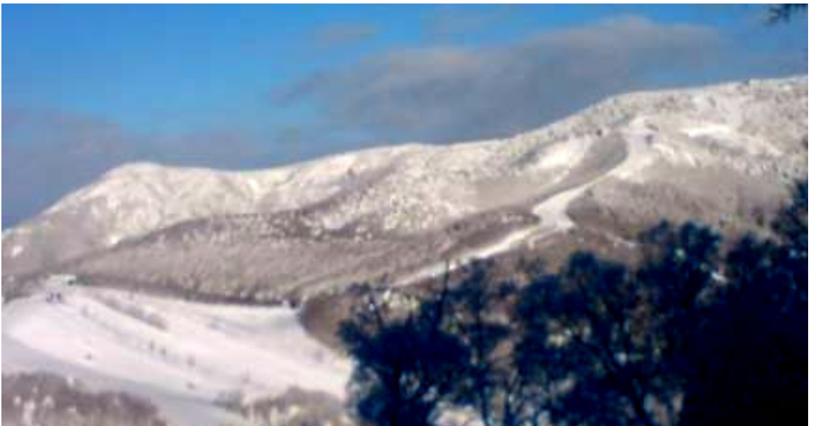
志賀高原・タンネの森から