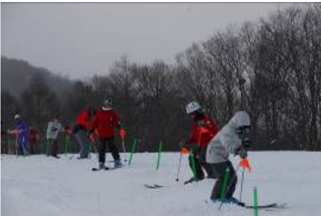
ポールを使ってコブづくり

ーで年越しそばが食べられます。ビデオミーティングを中断して全員でロビーに向かい紅白歌合戦をみながら食べました。