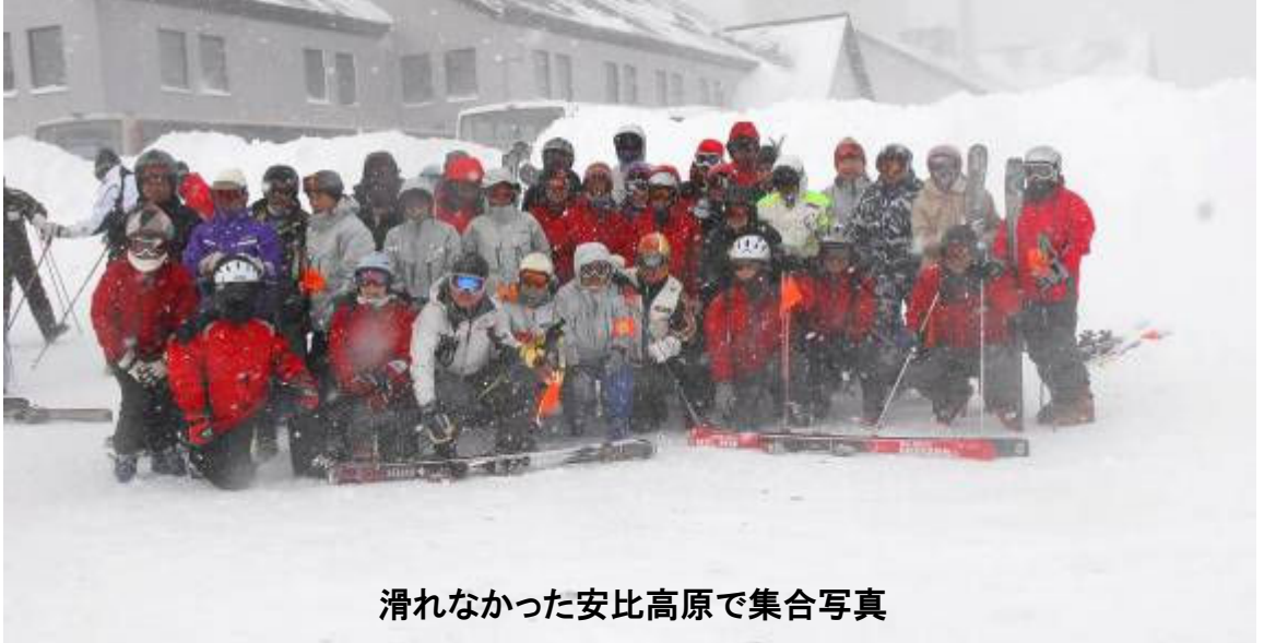
滑れなかった安比高原で集合写真