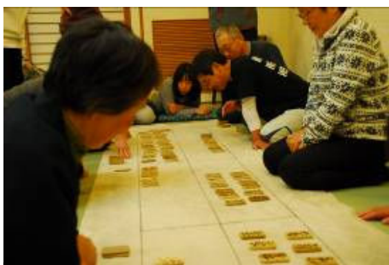
百人一首を使ったカルタ取り

20年前は、参加者も20代30代が中心で、中学生・小学生も10名近く参加していて、まさにファミリースキーでしたが、最近では参加者の高齢化が進み、20代1名、30代ゼロ、40代2名あとはすべて50歳以上という状況です。